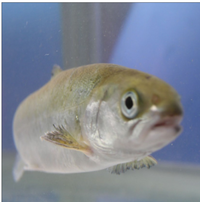
Denne laksesmolten bodde på Akvaforsk-alliansens forskningsstasjon på Sundalsøra.

Hvert år blir mer enn 350 millioner oppdrettssmolt satt ut i norske sjømerder. Men høy dødelighet etter utsett peker på at smoltifiseringen ikke alltid har vært like vellykket.